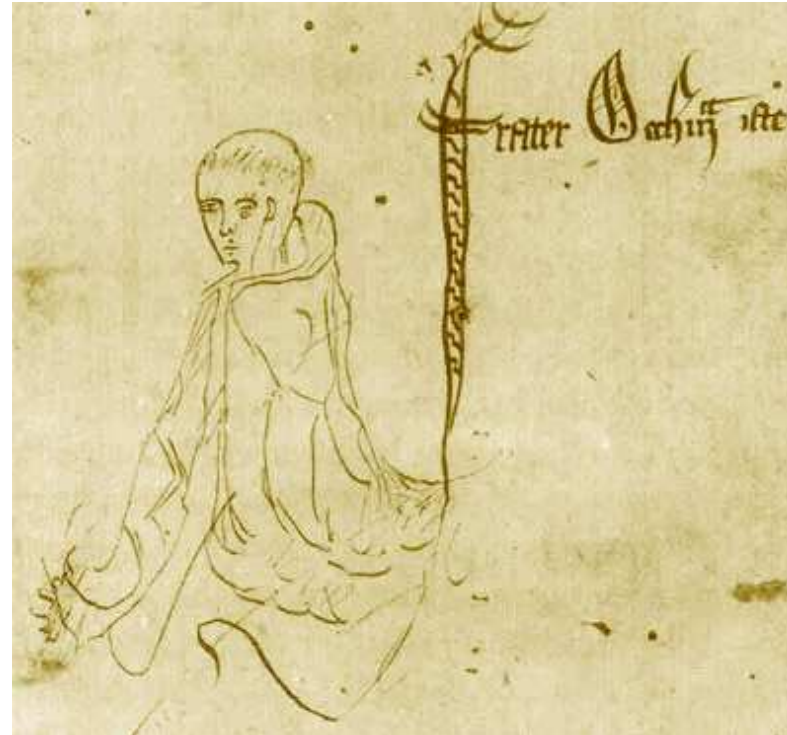
Manuscrito de Summa Logicae de Ockham