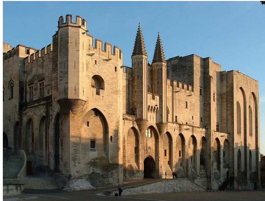
Palacio de los Papas, Aviñón Imagen en Wikimedia Commons