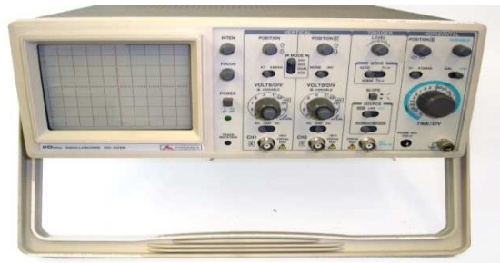
Imagen 1: Controles del osciloscopio.

Fuente: Banco de imágenes del ITE . Licencia: Creative Commons