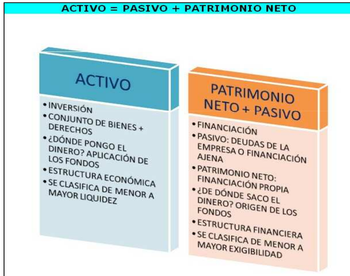
Imagen 2. Elaboración propia