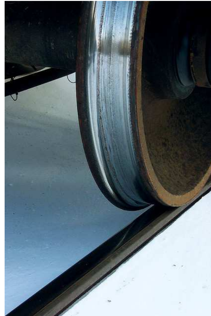
Train Wheel