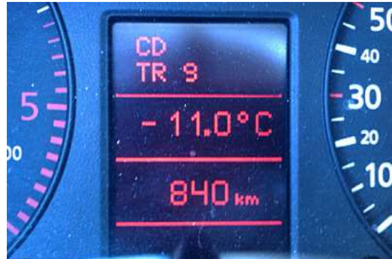
Temperatura Exterior de José Antonio Herran, CC by-nc-sa 2.0