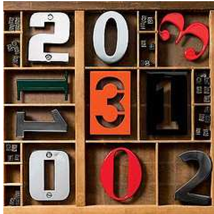
Spiekermann House Numbers de Stewf , CC by-nc-sa 2.0