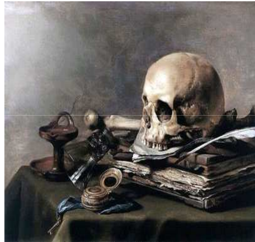
Imagen 1. Autor: Pieter Claesz . Dominio público