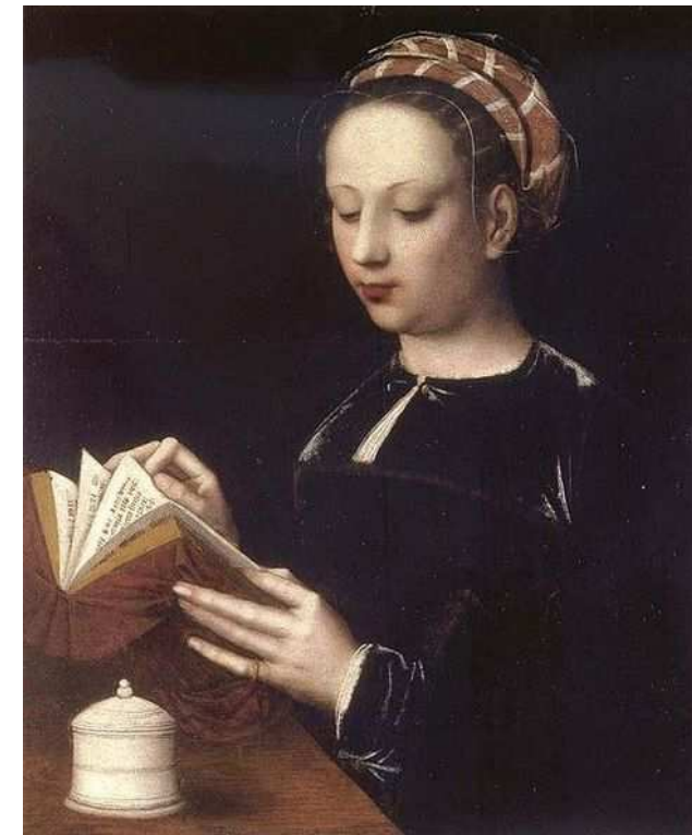
Imagen 1. Autor: Ambrosius Benson . Dominio público