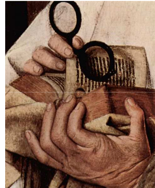
Imagen 1. Autor: Jan van Eyck. Dominio público