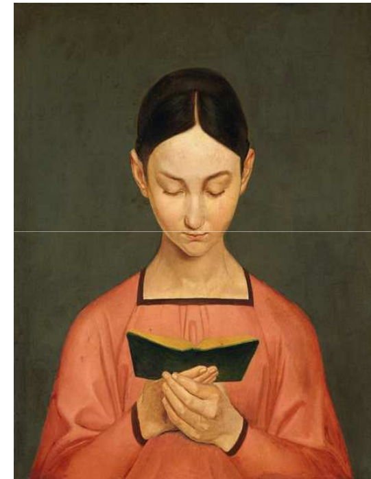
Imagen 1. Autor: Gustav Adolph Hennig. Dominio público