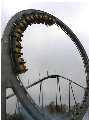
Imagen de Stefan Scheer de dominio público