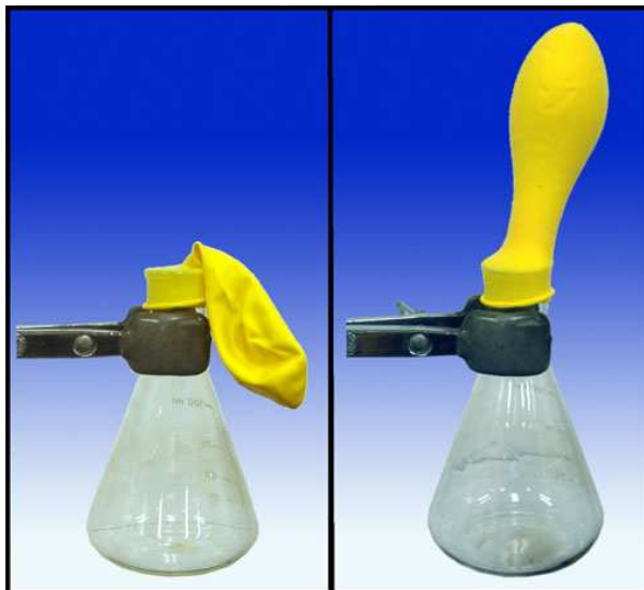
Imagen 3 de elaboración propia