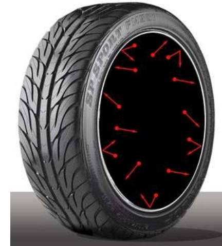
Imagen 4 de elaboración propia