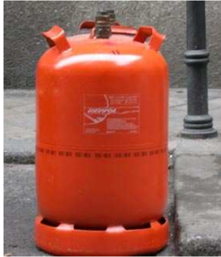
Imagen 1 de CNICE , uso educativo

Es el más sencillo de estudiar, porque todos los gases tienen propiedades físicas parecidas: son sustancias que ocupan totalmente el recipiente que los contiene, que se mezclan fácilmente, se pueden expandir y comprimir con facilidad, generan una presión que depende de la cantidad de gas que hay en el recipiente (además de su volumen y de la temperatura a la que se encuentren) y son muy poco densos.