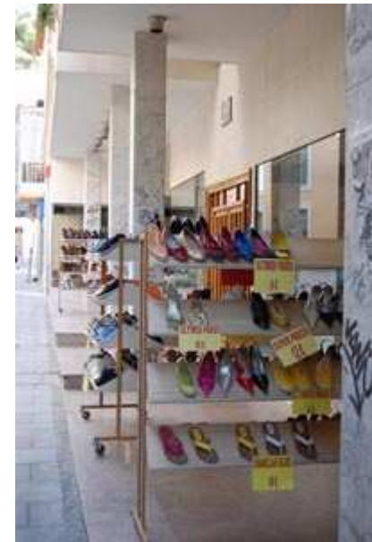
Imagen 3 . Imagen de creación propia.