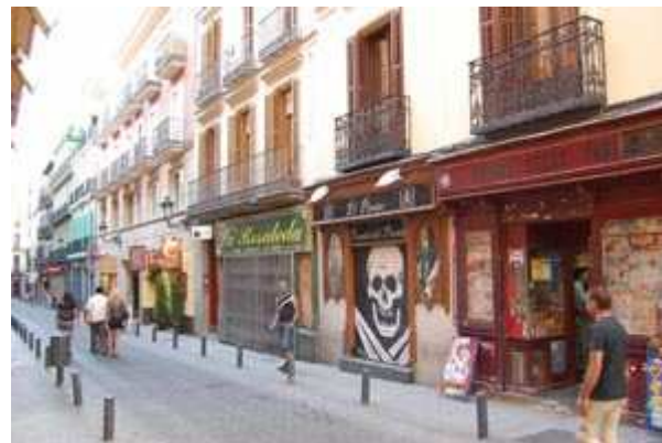
Imagen 1 . Imagen de creación propia.