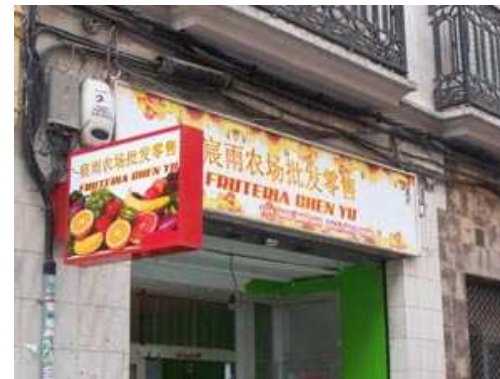
Imagen 4 . Imagen de creación propia.