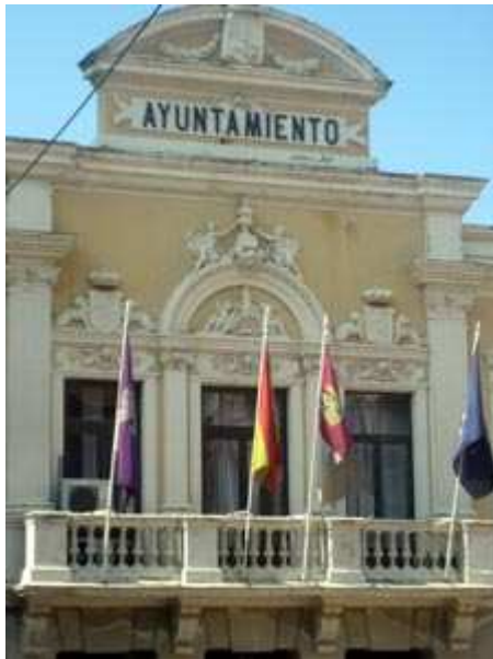
Imagen 3. Autor: Creación propia.