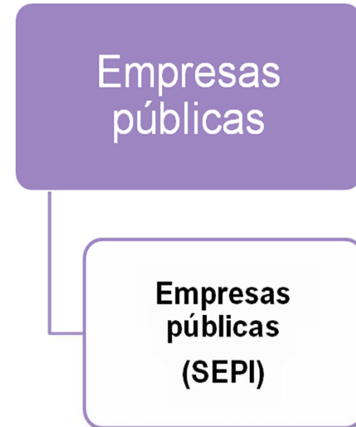
Imagen 4. Autor: Creación propia.