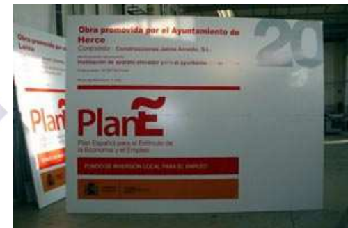
Imágenes 5,6 y 7. Autor: Creación propia