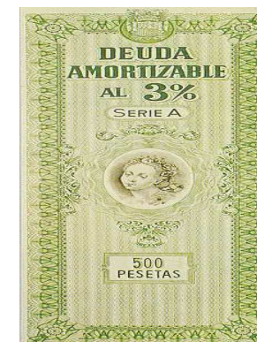
Imagen 11. Autor: Desconocido .