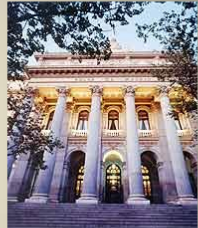
Bolsa de Madrid.