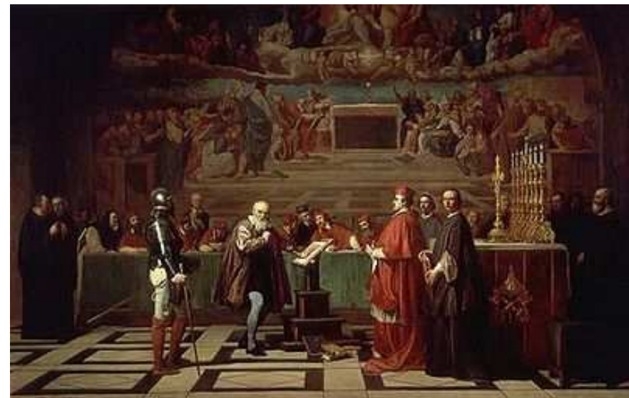
Pintura de Robert Fleury , de uso libre, donde se representa el juicio a Galileo