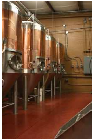
Imagen 2. Autor: Sagdejev . Licencia Creative Commons

Estos procesos se realizan en llevan a cabo dentro de tanques, que reciben el nombre de biorreactores o fermentadores industriales .