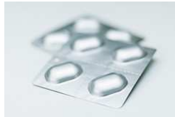
Imagen 1. Autor: Kozumel . Licencia Creative Commons