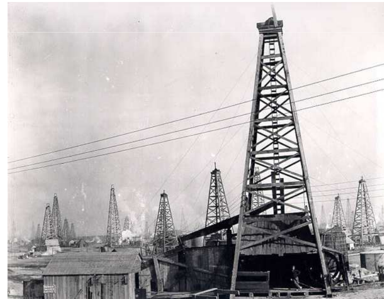
Imagen 4. Autor: Nv8200p . Dominio público