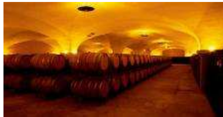
Imagen 2. Autor: ITE . Licencia Creative Commons