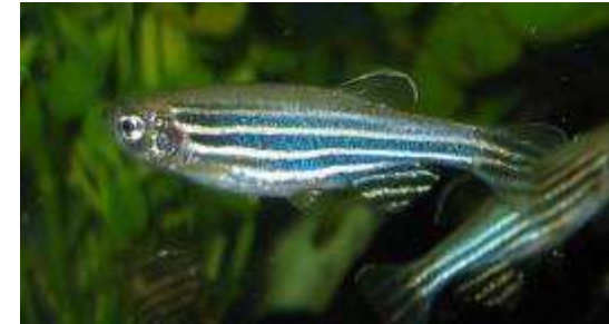
Imagen 5. Autor: Azul . Dominio público