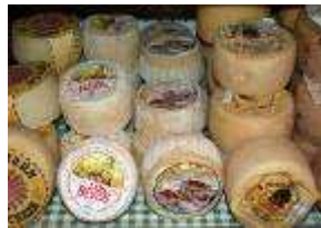
Imagen 1. Autor: ITE . Licencia Creative Commons

Biotecnología: conjunto de técnicas que utilizan las potencialidades de los seres vivos o de compuestos procedentes de ellos para la obtención de productos, bienes y servicios.