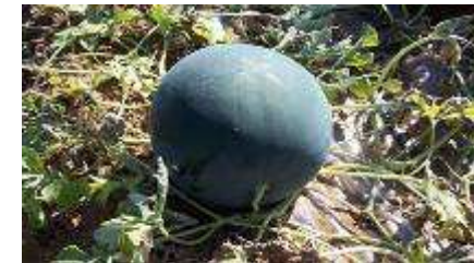
Imagen 6. Autor: ITE . Licencia Creative Commons