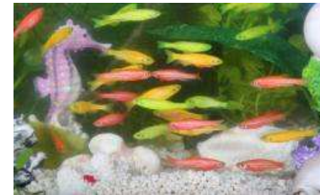
Imagen 3. Autor: Glofish . Dominio público